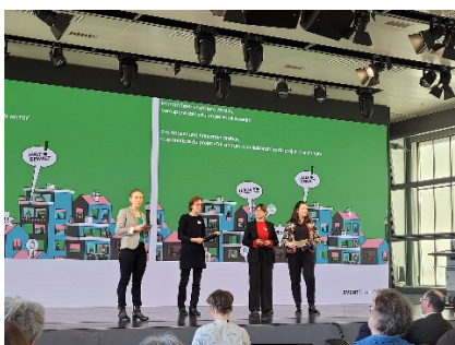
Die Projektleiterinnen auf der Fachtagung

Das Stadtteilsekretariat besuchte in Bern die erste nationale Fachtagung gegen häusliche Gewalt. Die Projekte «Tür an Tür» sowie unser Schwester-Projekt in Basel «Halt Gewalt» haben sich vorgestellt und alle anwesenden Fachpersonen zur Nachahmung in der ganzen Schweiz ermutigt. Wir nehmen mit, dass die Verankerung in den Quartieren mit Quartiertreffpunkten und Schlüsselpersonen aus der Nachbarschaft ein wichtiger Baustein für den Erfolg der Präventionsarbeit ist. Wer das Projekt in Basel praktisch erleben möchte, kann im April bei unterschiedlichen Angeboten in der Aktionswoche vom 13. bis 21.04. mitmachen. Verteilt über das ganze Kleinbasel gibt es Aktionen, wie z.B. Boxtraining, Filmvorführungen, Stadtrundgang, Siebdruck, die zum Thema häusliche Gewalt sensibilisieren. Wie man sich als Zeug:in von häuslicher Gewalt unterstützend verhält, lernt man in drei verschiedenen Workshops. Hier geht es zum Programm.